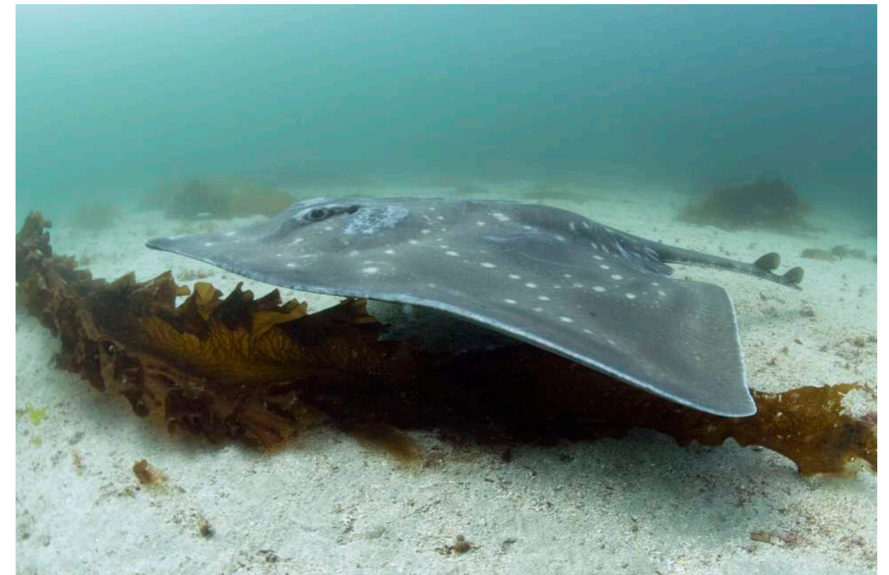
Vleet, Dipturus batis.

(3) https://open.overheid.nl/documenten/ronl-99d46f4b-1d45-49cd-a979-2ce8bf737e22/pdf